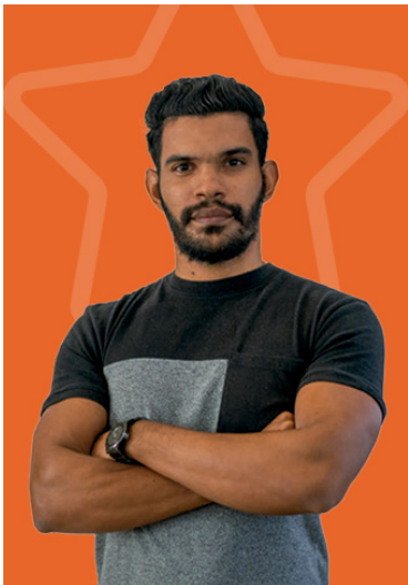
Alejandro Benítez Media