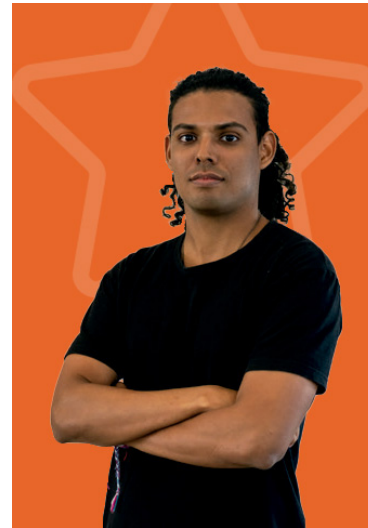
Leandro García Diseño